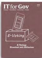
IT for Gov

Versand: 1x / Jahr Auflage: 20 350 Leser: 122 100