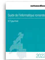
Guide de l'informatique romande

Das Schweizer ICT-Jahrbuch 2021 erscheint in Zusammenarbeit mit dem Dachverband ICTswitzerland zum 18. Mal und wird exklusiv an der traditionellen ICT-Networking-Party präsentiert und allen Teilnehmern abgegeben