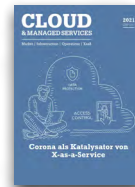
Cloud & Managed Services

Versand: 1x / Jahr Auflage: 9 000 Leser: 54 000