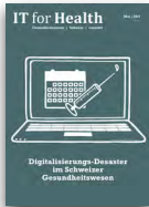
IT for Health

Beleuchtet alle Themen rund um die Digitalisierung und ICT-Beschaffung im Schweizer Gesundheitswesen.