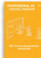
Professional AV & Digital Signage

Versand: 1x / Jahr Auflage: 19 600 Leser: 117 600