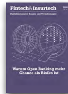
Fintech & Insurtech

Versand: 1x / Jahr Auflage: 9 000 Leser: 54 000