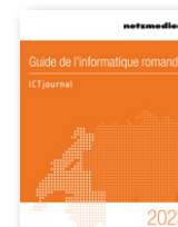
Guide de l'informatique romande

Versand: 1x / Jahr Auflage: 20 350 Leser: 122 100