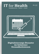
IT for Health

Beleuchtet alle Themen rund um die Digitalisierung und ICT-Beschaffung im Schweizer Gesundheitswesen.