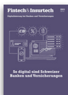
Fintech & Insurtech

Versand: 1x / Jahr Auflage: 9 000 Leser: 54 000