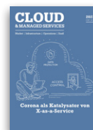
Cloud & Managed Services

Versand: 1x / Jahr Auflage: 9 000 Leser: 54 000