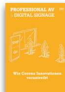
Professional AV & Digital Signage

Versand: 1x / Jahr Auflage: 19 600 Leser: 117 600