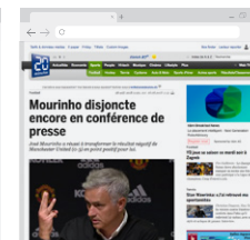
annonce native affichée sur 20minutes.ch