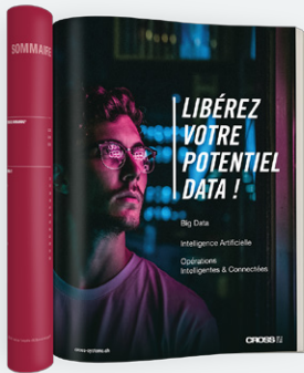
Annonce (exemple 1/1 p.)