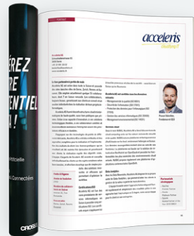
Profil d'entreprise (exemple 1/1 p.)