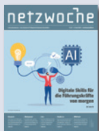
Netzwoche Das leserstärkste Schweizer Fachmagazin für Business-IT