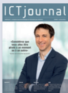
ICTjournal Das einzige Westschweizer Fachmagazin für ICT-Business-Entscheider