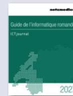
Erscheinungstermin Januar 2027

Das Schweizer ICT-Jahr- buch erscheint in Zusam- menarbeit mit Digital Switzerland und wird exklusiv an der traditi- onellen ICT-Networ- king-Party präsentiert und allen Teilnehmern abgegeben.