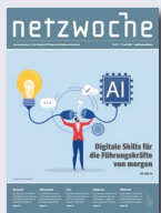
Netzwoche Das leserstärkste Schweizer Fachmagazin für Business-IT