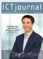
ICTjournal Das einzige Westschweizer Fachmagazin für ICT-Business-Entscheider