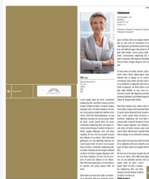
Company Profile 1/2 hoch