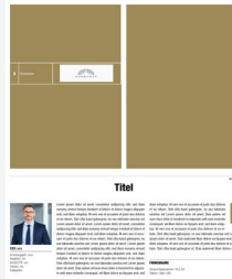
Company Profile 1/3 quer