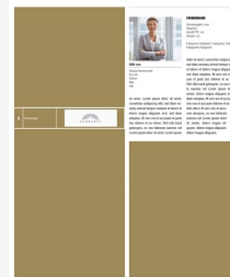
Company Profile 1/4 hoch