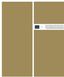
Logoplatzierung mit Claim/Slogan innerhalb des Rankings