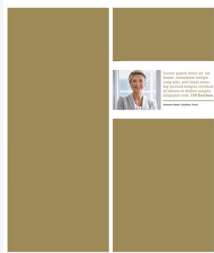
CEO-Quote mit Bild

Alle Autoreninformationen mit Layout- und Onlinebeispielen finden Sie hier!