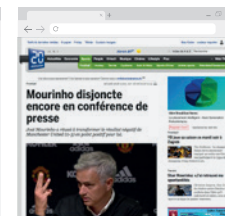
annonce native affichée sur 20minutes.ch